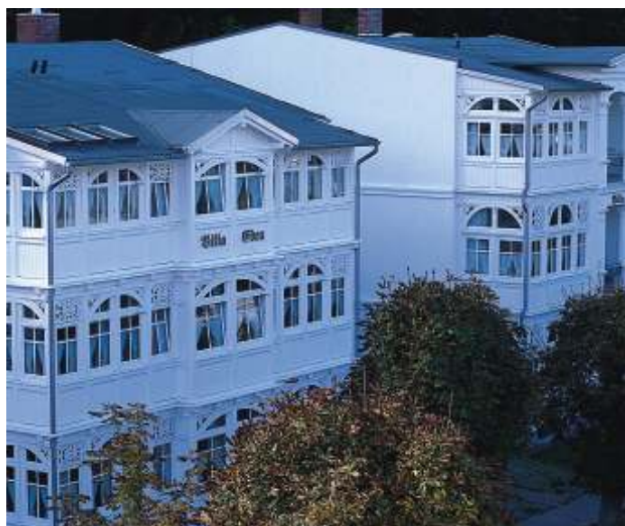
VILLA EDEN Putbuser Straße 14 und 16

An einer Kastanienallee, nur dreihundert Meter vom Strand und der Promenade entfernt, erwarten Sie komfortable Ferienwohnungen in ruhiger Lage direkt am Waldrand gegenüber dem Kurpark.