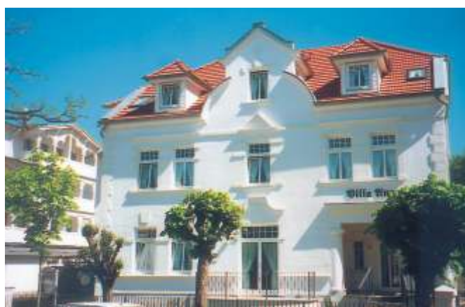
VILLA ANNABELLE Heinrich-Heine-Straße 1

Die VILLA ANNABELLE liegt im alten Ortskern von Binz, zwei Gehminuten vom Kurplatz, der Seebrücke und dem Strand entfernt. Erinnerung an die Eleganz des historischen Binz werden wach: Klassische Säulen und Stuckornamente, schmiedeeiserne Balkone, aufwendig im alten Stil restauriert. Ein Haus, das zu Recht den Namen »Villa« verdient.